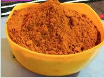
वायगाव वाणाची हळद पावडर