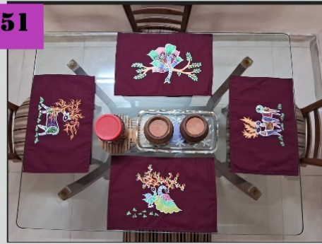
टेबल मॅटची किमत साईजनुसार आकारण्यात येईल