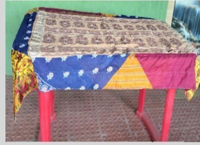
डायनिंग टेबल टॉप (४ स्तर) ६६ X ४६ इंची, किमत - रु. ८००/-