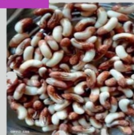
गावरान चवळी दाणे