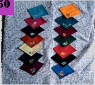
टि कोस्टर, ५ X ५ इंची, किमत - रु. २००/- (६ पिसेस)