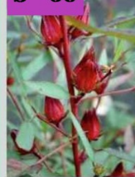
अंबाडी फुलाचे सरबत

Roselle powder Product of Adishakti Organic Farm