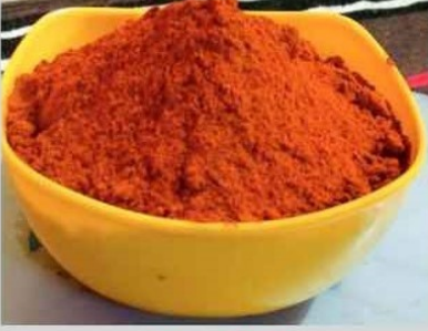
लाल मिरची तिखट