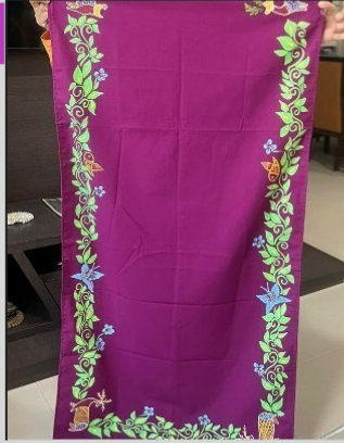
टेबल रनर १४ X ४१ इंची, किमत - रु. ४५०/-