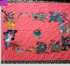
गोंडी पेंटिंग टेबल क्लॉथ ३५ X ५० इंची, किमत - रु. ८००/-