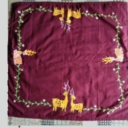
टेबल क्लॉथ ३५ X ५० इंची, किमत - रु. ६००/-